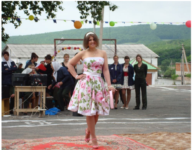
Платье «Джонни Роуз» заняло 1 место в конкурсе «Лето-2012»

выполненное в стиле «романтическое ретро», под названием «Джонни Роуз».