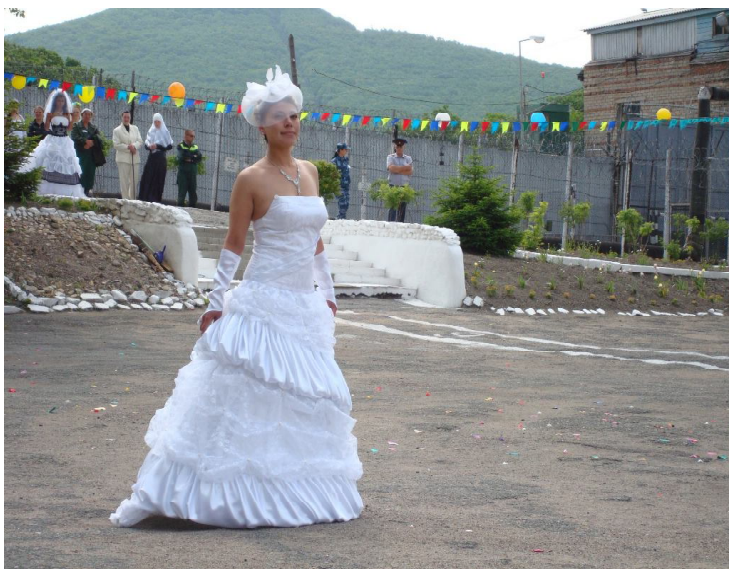
1 место в конкурсе «Бал невест» - платье «Пышная хризантема»

и представили на суд зрителей обилие ярких, интересных, экстравагантных, модных моделей одежды с необычными названиями: «Лунная ночь», «Майский коктейль», «Шармель», «Ситцевое лето» и другие. Жюри признало лучшим платье,