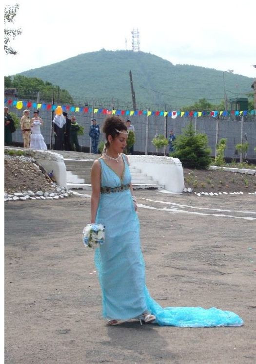
Фантазийное свадебное платье "Греческая мечта"

эсклюзивных вещах! Наряды к конкурсу мы придумывали и шили заранее. Каждое платье или костюм - большая работа, созданная несколькими людьми. Конечно, все это было бы невозможно без помощи и поддержки администрации колонии!