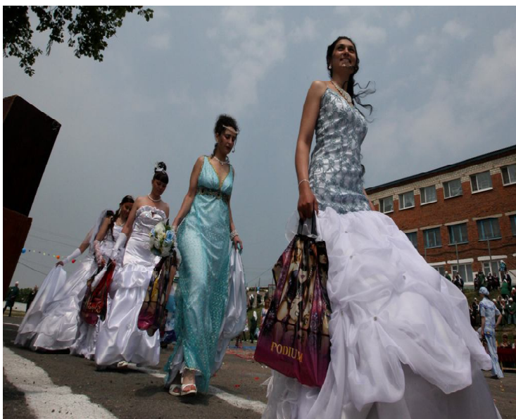
Участницам конкурсного дефиле были вручены призы

справиться с волнением, - поделились с приглашенными на праздник представителями СМИ участницы дефиле.- Независимо от того, заняла ли та или иная модель призовое место, приятно было пройти перед зрителями в таких красивых и